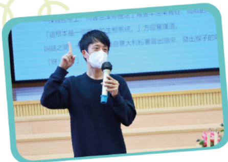
與作家一樹哥哥的魔法約會